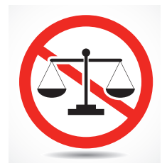
Ik wraak u!

Al weer een goede reden om in de rechtszaal de zware woorden 'Ik wraak u!' te spreken. Maar of het nu verstandig is? De meeste wrakingsverzoeken worden afgewezen en u moet dan wel verder met de eerder door u gewraakte rechter.