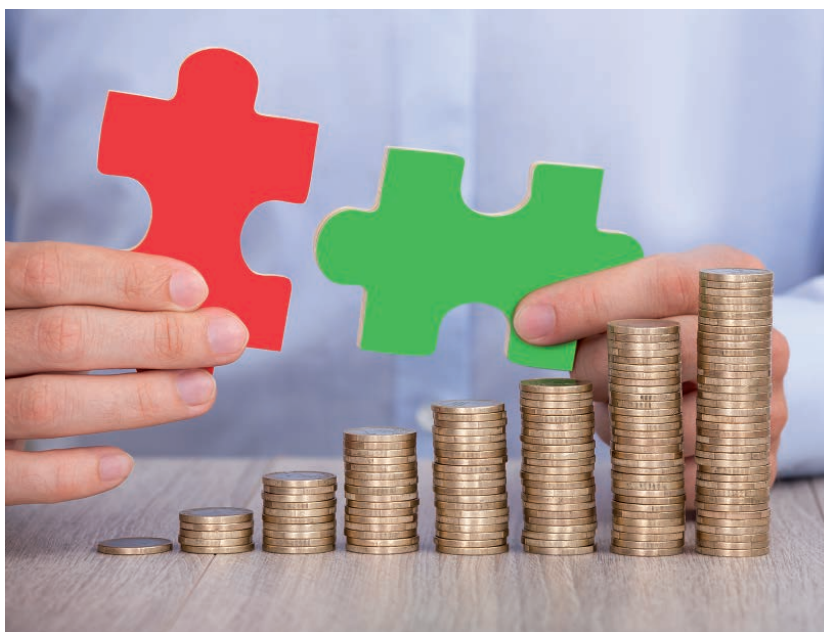
Rumoer rond bijheffing

Aan de Tweede Kamer is toegezegd dat belastingplichtigen vier maanden extra de tijd krijgen om de naheffing te betalen. Die extra vier maanden komen bovenop de gebruikelijke betalingstermijn van zes weken. Daardoor zal volgend jaar pas na een periode van 5,5 maand rente in rekening gebracht worden.