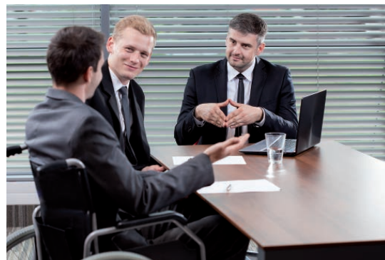
Betere stroomlijning aannamebeleid gehandicapten

Het is één van de kroonjuwelen van staatssecretaris Jetta Klijnsma van Sociale Zaken; het creëren