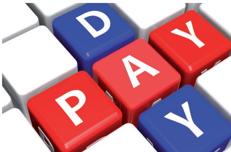
Genade voor recht: langere termijnen

Eventueel zult u een correctie moeten aanbrengen in de voor ingevulde aangifte IB 2013