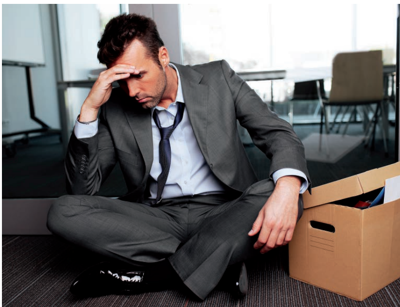
Betekent ontslag bestuurder ook einde managementovereenkomst?

Kijk uit met het te laat betalen van salaris. Het burgerlijk wetboek (BW) kent een bijzondere (en dure!) verdragingsregeling. De eerste drie verdragingsdagen zijn nog gratis, over verdragingsdag vier tot en met acht is de werkgever vijf procent van het bruto dagloon verschuldigd en vanaf verdragingsdag negen is één procent verschuldigd. Daar bovenop komt ook nog de wettelijke rente!