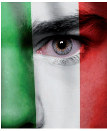
Hoop voor 30%-regeling