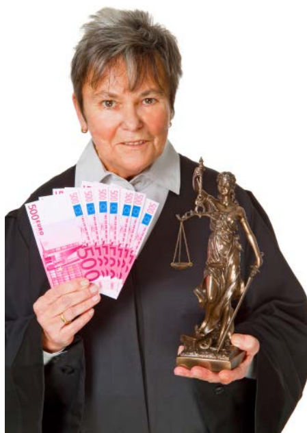
Geen geld, toch beroep

Wie in Nederland zijn recht zoekt, en daarvoor bij een rechter komt, zal eerst een bedrag aan griffierecht moeten betalen voordat hij (figuurlijk dan) toegang krijgt tot de rechtszaal. Het kan daarbij, gelet op de recente verhogingen, zeker voor rechtspersonen om stevige bedragen gaan. Maar wat nu als je nu (mede door toedoen van de fiscus en/of door eerder opgelegde boetes) zo arm bent als een kerkrat? Het kan toch niet zo zijn dat