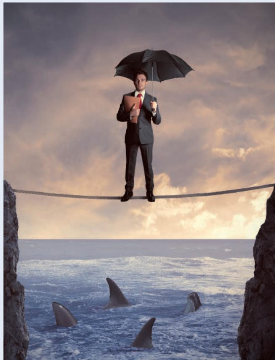
BV kon niet succesvol aansprakelijk gesteld worden

De handel in bv's met daarin een fiscale claim is de fiscus een doorn in het oog. Zeker als die handel tot gevolg heeft dat die fiscale claim niet betaald kan worden. Om dat alles te voorkomen is in de Invorderingswet een groot aantal aansprakelijkheden opgenomen. Die zijn zo ruim dat niet alleen de doorgewinterde fiscale fraudeur, maar ook de goedwillende ondernemer al snel aan het fiscale mes geregen kan worden. Bijvoorbeeld als die zijn werk-bv (met daarin een herinvesteringsreserve) verkoopt. Hof Amsterdam heeft nu beslist dat in zo'n geval niet de verkopende bv aansprakelijk gesteld kan worden. Alleen natuurlijke personen ('mensen van vlees en bloed') kunnen in deze situatie aansprakelijk zijn. Eerder was Rechtbank Gelderland in een soortgelijke zaak tot een ander oordeel gekomen. De vreugde zal echter betrekkelijk zijn geweest, nu de dga een natuurlijk persoon was, en deze volgens de rechter terecht aansprakelijk was gesteld.