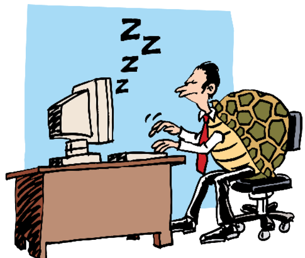
Uitstel bij de fiscus

Een inkomenssoort die voor veel onduidelijkheid (en dus rechtspraak zorgt) is de per 1 januari 2001 in de Wet IB 2001 opgenomen categorie 'belastbaar resultaat uit overige werkzaamheden'. Daar maakt ook de beruchte terbeschikkingstellingsregeling (TBS) deel van uit. In een nieuw besluit is eerdere wetgeving en rechtspraak verwerkt. Met name is meer duidelijkheid gekomen over het aanvangs- en beëindigingstijdstip van een terbeschikkingstelling (bijvoorbeeld aan de eigen bv). Ook is aandacht besteed aan de fiscale gevolgen van de zogeheten (on)zakelijke lening. Voor de praktijk is het plezierig dat bij het verstrekken van een lening vooraf aan de fiscus duidelijkheid kan worden gevraagd over de fiscale gevolgen van de lening.