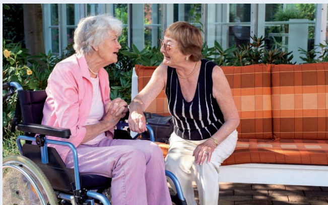
Commotie rondom eigen bijdrage AWBZ bij opname in een verpleeginstelling

Voor beide opties geldt: om in aanmerking te komen voor aftrek in 2015, dient u de premies ook daadwerkelijk in 2015 te betalen. De mogelijkheid om dat later te doen (namelijk voor 1 april van het volgende jaar) is enkele jaren geleden komen te vervallen. De terugwenteling van zes maanden bij staking van de onderneming en de omzetting van de oudedagsreserve, bestaat nog wél.