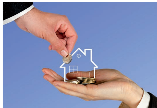
Verruimde schenkingsvrijstelling voor eigen woning keert terug

De in 2013 ingevoerde tijdelijke verruiming van de schenkingsvrijstelling voor de eigen woning is per 2015 verdwenen. De regeling was volgens minister Dijsselbloem altijd als een tijdelijke regeling bedoeld, heeft inmiddels zijn werk (het weer op gang brengen van de woningmarkt, de minister sprak van een 'kickstart') gedaan en er was dan ook - ondanks smeebeden uit de sector - geen reden om de maatregel te verlengen. Het is daarom bijzonder opmerkelijk dat deze fiscale faciliteit in het Belastingplan 2016 weer van stal is gehaald. Om budgettaire redenen gaat de rege-