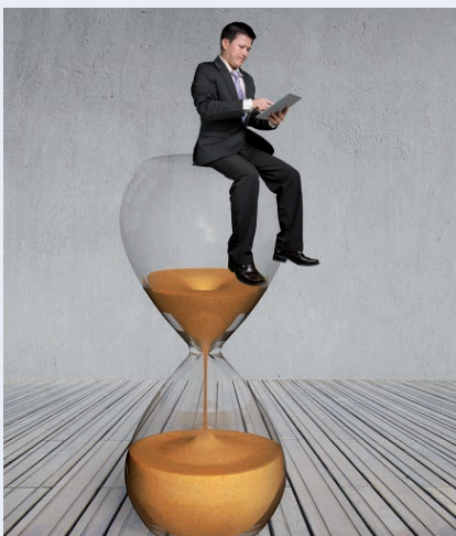
De urenadministratie bijwerken

Ga na of u nog dit jaar bedrijfsmiddelen moet aanschaffen, om te voorkomen dat u uw herinvesteringsreserve verspeelt.